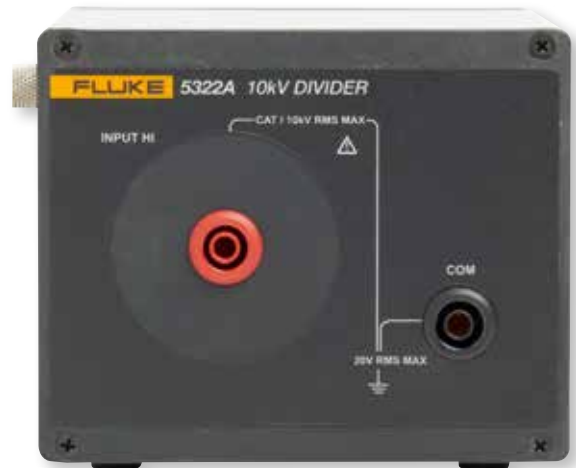
Der 5322A verfügt über einen externen 10-kV-Teiler zum Messen an Prüfgeräten mit 10-kV-Ausgängen.

Durch eine breite Palette von Optionen können Sie das geeignetste Modell für Ihre Kalibrieraufgaben und Ihr Budget auswählen.