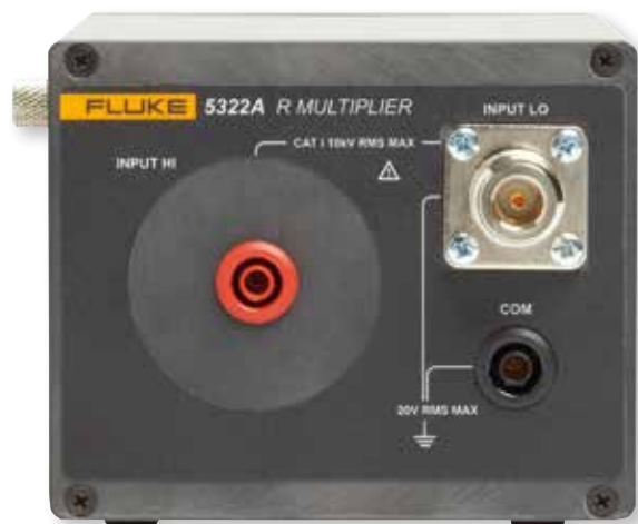
Jeder 5322A wird mit einem externen R-Multiplikator zum Ausgeben von Widerständen von bis zu 10 TΩ zum Prüfen von Isolationsmessgeräten geliefert.