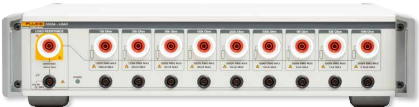
Zusätzlich erhältlich: 5322A-LOAD, hochohmige Last für Spannungen bis zu 5-kV